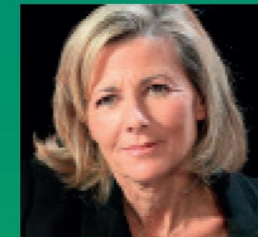
CLAIRE CHAZAL Journaliste, écrivain