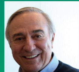
ALLAIN BOUGRAIN DUBOURG Journaliste, président de la Ligue pour la protection des oiseaux