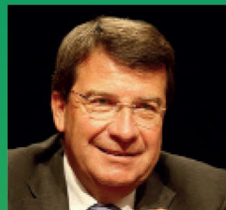
XAVIER DARCOS Ancien Ministre, Membre de l'Académie française