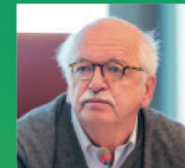
ÉRIK ORSENNA Écrivain, Membre de l'Académie française